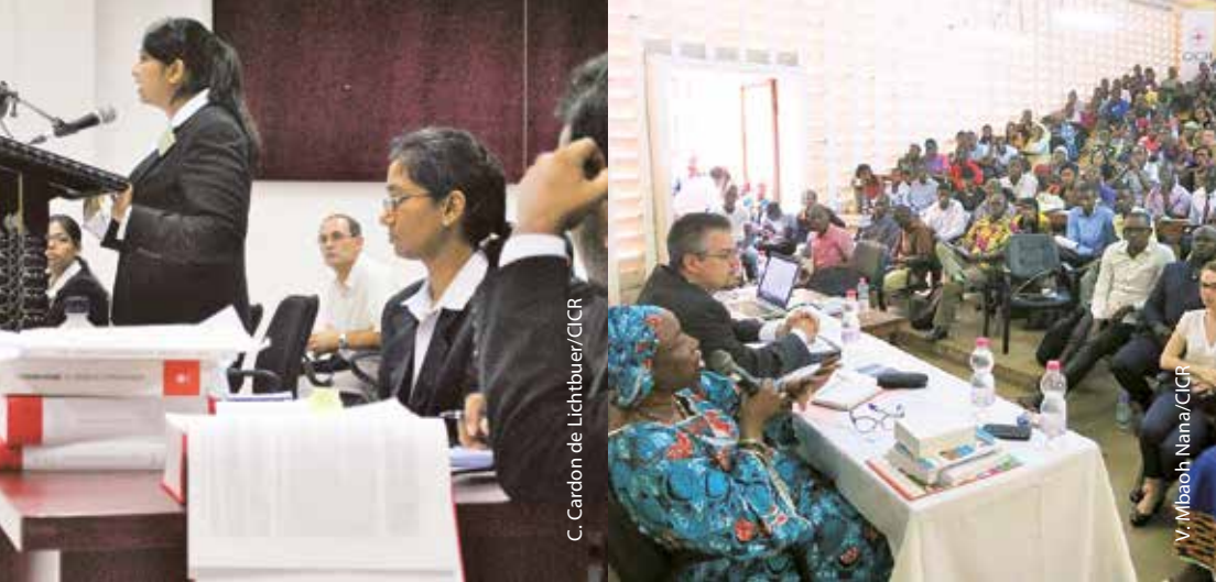
C. Cardón de Lichtbuey/CICR