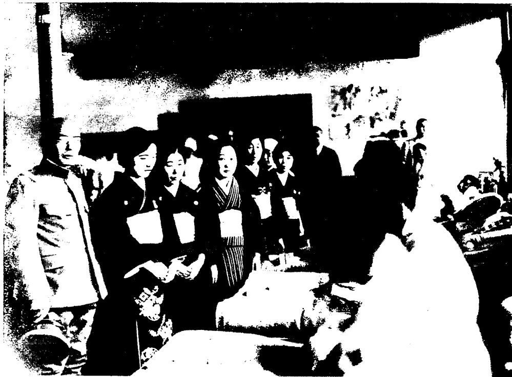
Association de dames infirmières volontaires.