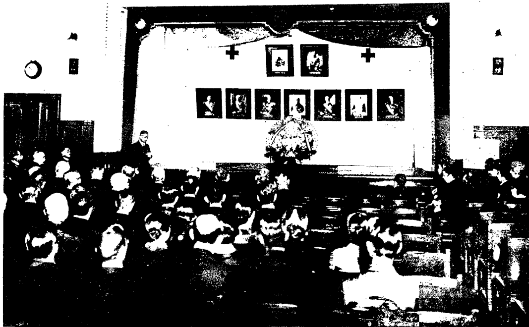
A la salle de lecture du Musée. Cérémonie commémorative des bienfaiteurs de la Croix-Rouge.