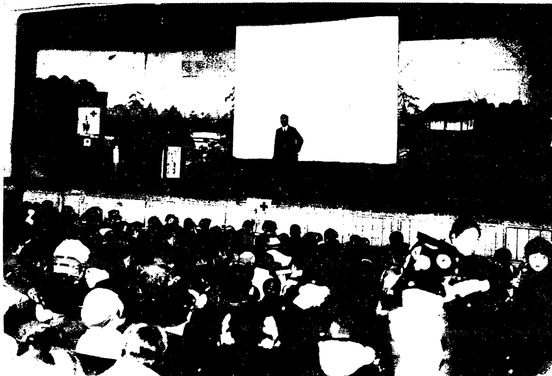
Séance de cinéma, lectures dans la grande salle publique de Port-Arthur.